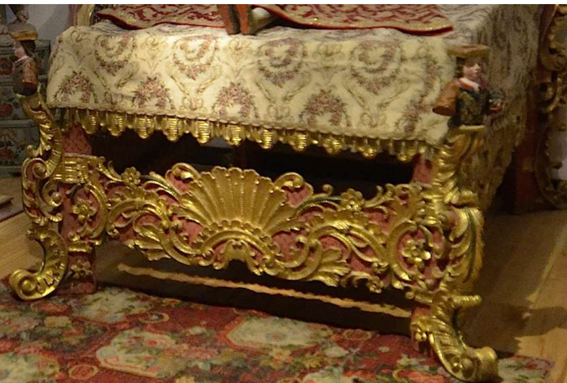
Pie de cama. Detalle de la cama del conjunto escultórico de la “Dormición o Tránsito de la Virgen María”

En la parte central y frontal del pie de la cama se ubica una rocalla de gran tamaño, alrededor se observan diferentes tipos de flores como rosas y azucenas con sus respectivos tallos de color verde.