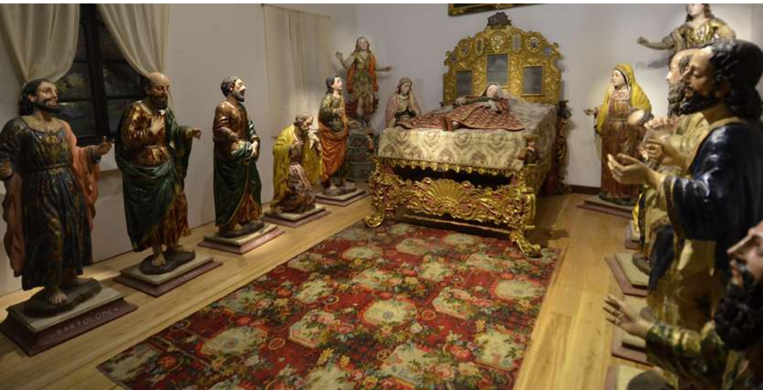
Cama del conjunto escultórico de la “Dormición o Tránsito de la Virgen María”.