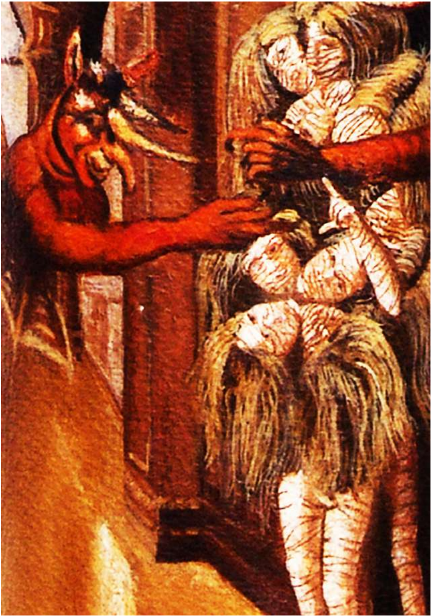
Detalle de la etiqueta de Mandrágora, obra de David Santillán que representa las alteraciones genéticas, los demonios de la nueva época.