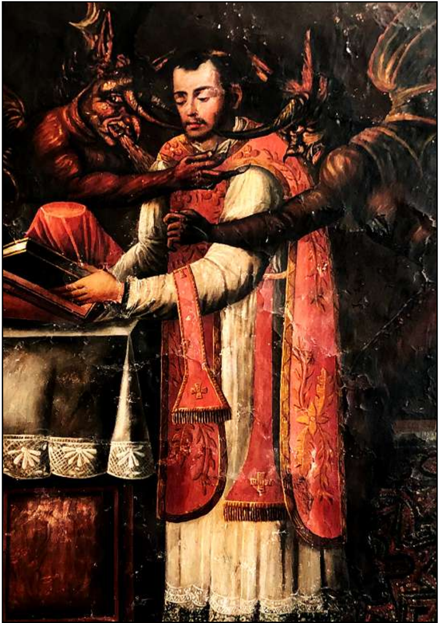
Detalle del mural del siglo XIX. Santa Teresa intercede para que los demonios se alejen del sacerdote pecador.